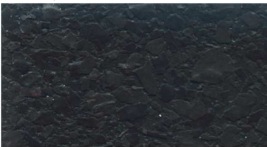
V 249 / schwarz