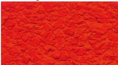
V 436 / korallenrot