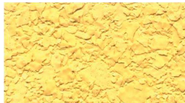
V 356 / sandgelb