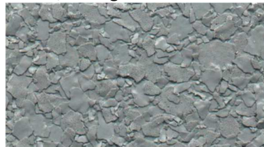
V 545 / grau