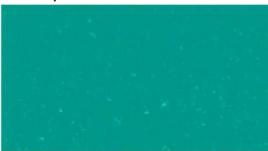
V 785 / türkis

Verpackungseinheiten: 5 kg oder 10 kg im Eimer 20 kg im Karton