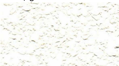
V 150 / weiß