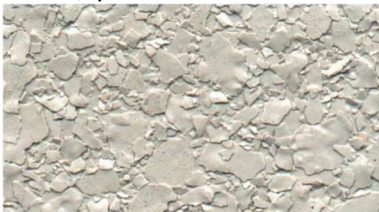
V 542 / hellgrau