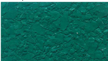
V 786 / patinagrün